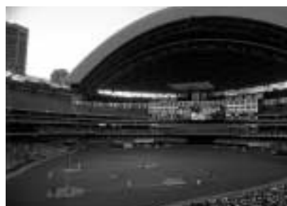
熱気あふれるトロントスカイドーム。

10年前、初めて外国と貿易を開始した際は、まるで武家の商法。毎日クレーム対処に明け暮れ「こんなじゃ、やってられねえ」と何度も投げ出しそうになったが、今ではそれも笑い話。有り難いものである。