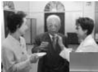
乾杯は、新本副会長。会場のあちこちで話が弾みました。