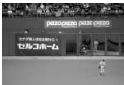
テレビでも放映された、社名広告幕